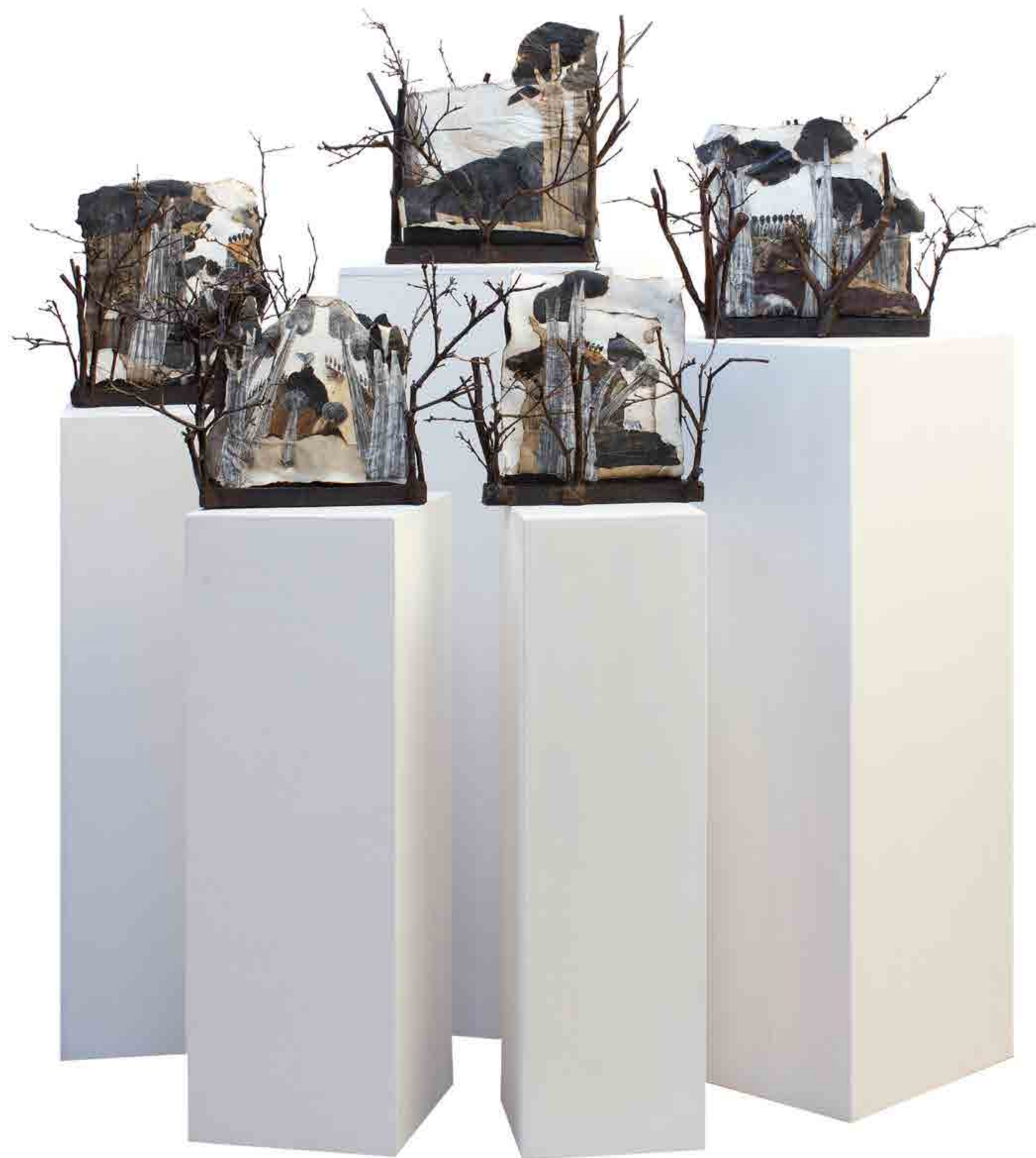
Angela Rapiro Cinque atti per "Il lupo e il rosso", 2017 tecnica mista, legno e specchio

mensionalità cerco di scavare, di andare oltre, di cercare negli strati del vissuto, della memoria, del tempo ciò che appartiene non solo a me, ma a tutti coloro che vivono condizionati "stati d'animo". Cerco nelle storie (trascrizioni di segni), cerco nella natura (forme fitomorfe e zoomorfe), cerco nella materia (elementi e tecniche polimerici). Ma non è soltanto desiderio di conoscenza. Perché non voglio soltanto conoscere. Mi interessa invece ri-conoscere, ri-conoscersi.