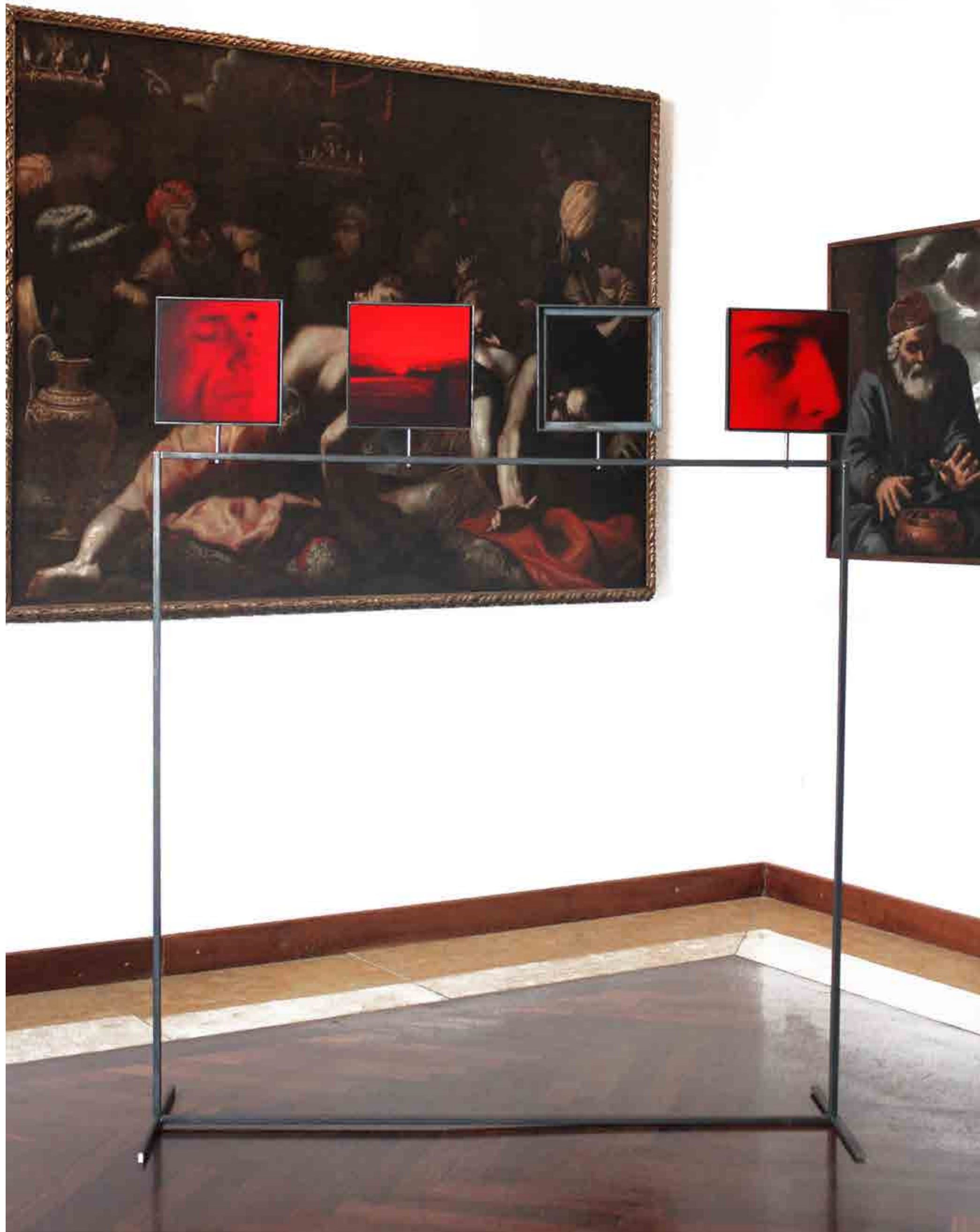
Eliana Petrizzi Egomorphosys , 2017 14 oli su carta d'Amalfi incollata su tavola, cm 25x25 ciascuno struttura di ferro