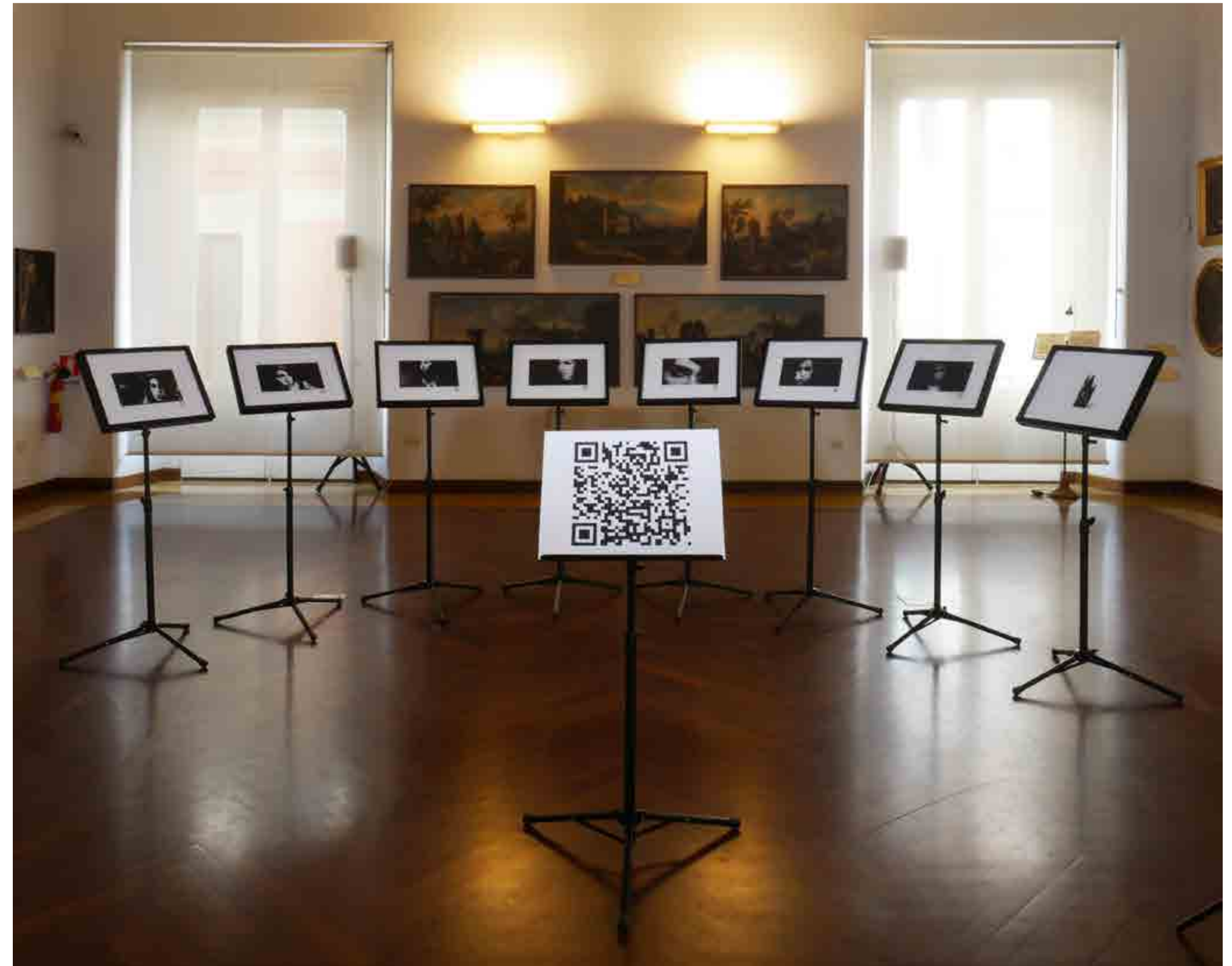
Francesca Poto Amy , 2016 acquatinta su lastra di zinco e installazione in ferro